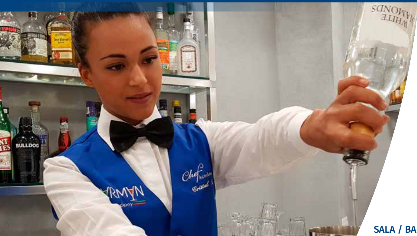
SALA / BAR